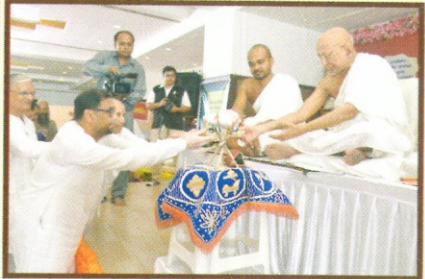
પેઢીના ટ્રસ્ટીઓ દ્વારા પૂજ્ય આચાર્ય ભગવંતને ગ્રંથ સમર્પણ