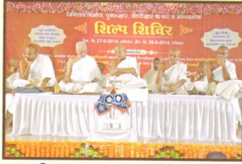
નિશ્રાદાતા પૂજ્ય આચાર્ય ભગવંતો