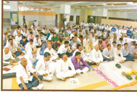
શિલ્પ શિબિરમાં ઉપસ્થિત જિજ્ઞાસુ શ્રોતાઓ