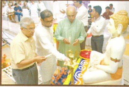
પેઢીના ટ્રસ્ટીઓના હસ્તે જ્ઞાનદીપ પ્રજ્વલન