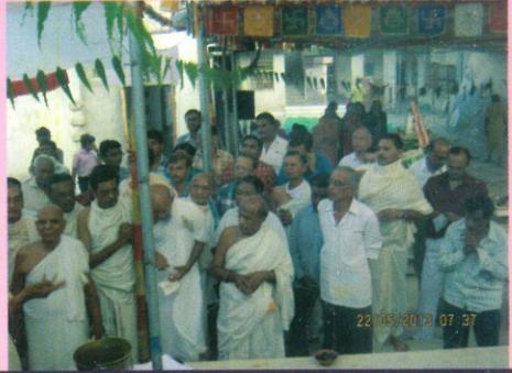
ભૂમિખનન પૂજન પ્રસંગે ઉપસ્થિત સકળ શ્રી સંઘ