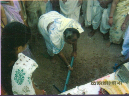
ભૂમિપૂજન તથા ભૂમિખનન તા. ૨૨-૫-૨૦૧૩ વૈશાખ વદ ૧૨