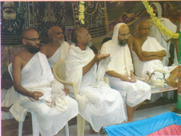
પૂ. ગુરુભગવંતોના આર્શીવચન