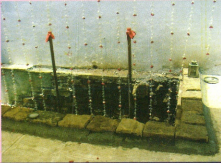
શિલાસ્થાપન તા. ૧૪-૭-૨૦૧૩