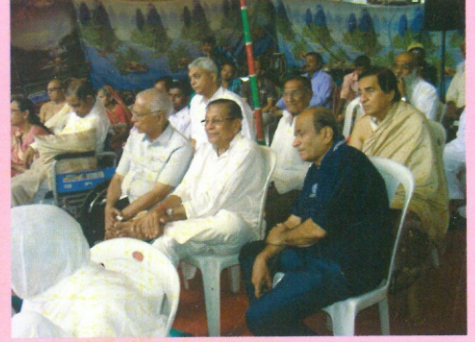
ઉપસ્થિત અગ્રણી મહાનુભાવો