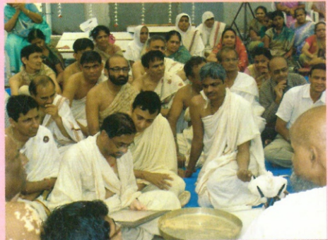
શિલાસ્થાપન વિધિ સમારોહ