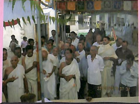
ભૂમિખનન પૂજન પ્રસંગે ઉપસ્થિત સકળ શ્રી સંઘ