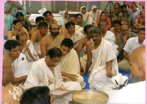
શિલાસ્થાપન વિધિ સમારોહ