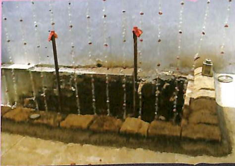
શિલાસ્થાપન તા. ૧૪-૭-૨૦૧૩