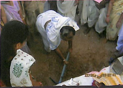
ભૂમિપૂજન તથા ભૂમિખનન તા. ૨૨-૫-૨૦૧૩ વૈશાખ વદ ૧૨