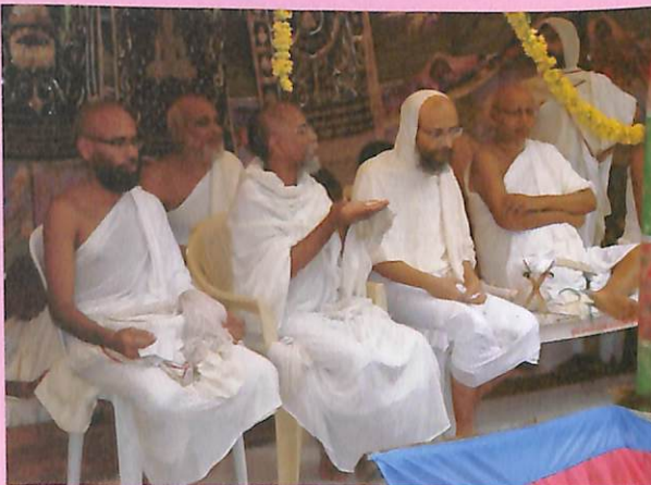
પૂ. ગુરુભગવંતોના આર્શીવચન